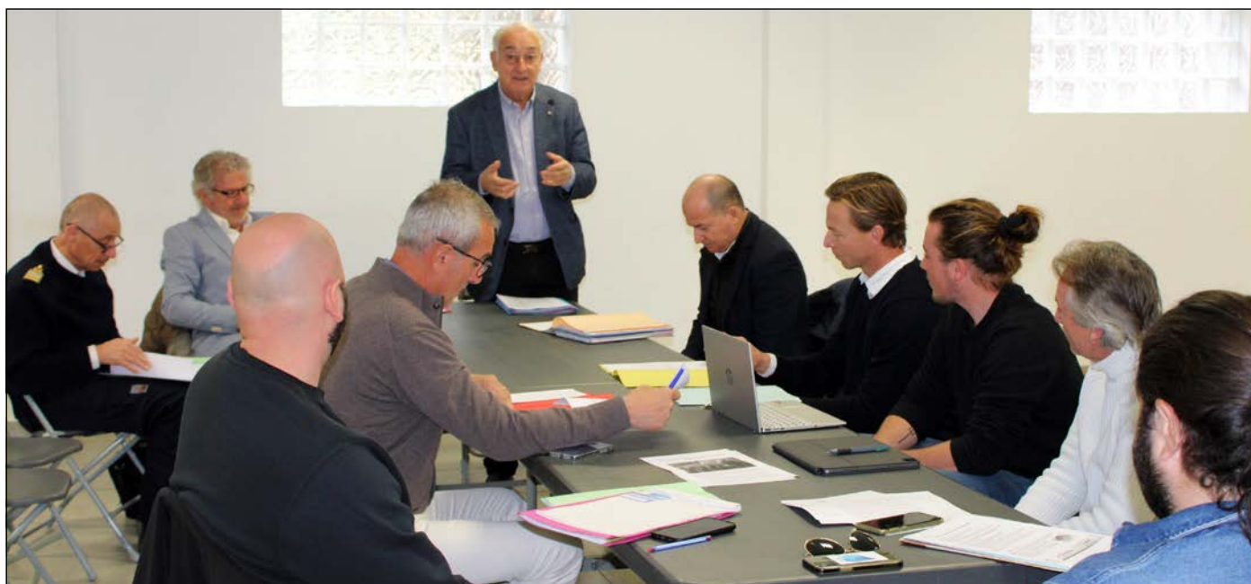
La section corse de l'institut français de la mer s'est réunie pour la première fois depuis sa création en décembre.

Réunis pour leur première rencontre décentralisée il y a quelques jours à Porto-Vecchio, « et il y a dans cette microrégion des enjeux maritimes majeurs », les membres de la section Corse ont évoqué des problèmes globaux liés au monde de la mer, comme les enjeux présentés au One ocean summit à Brest en février : « Les océans se détériorent de manière rapide et nous avons tous notre rôle à jouer : je pense, par exemple, aux enjeux qui touchent à la transition écologique, car la décarbonation du transport maritime va coûter très cher, vraisemblablement aux alentours des 6 000 milliards de